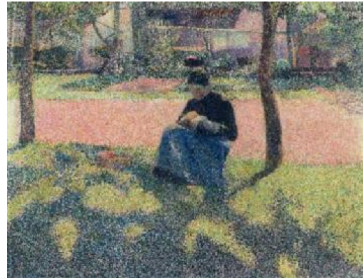
Henry van de Velde , Dorpsaangelegenheden. VII. Mazend meisje, De verstelster , 1890 Olieverf op doek, 78 x 101,5 cm