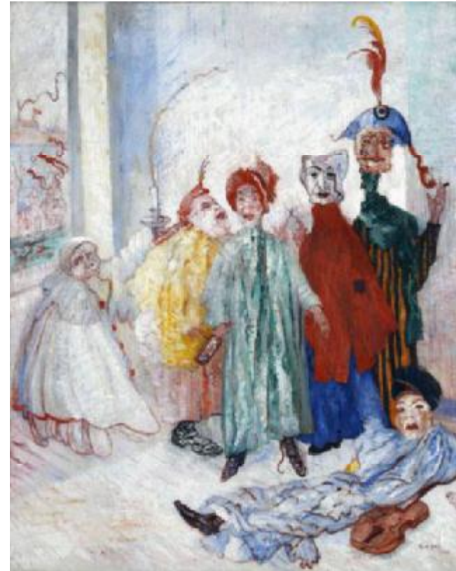
James Ensor, Zonderlinge maskers , 1892 Olieverf op doek, 100 x 80 cm © KMSKB, SABAM 2011, fotograaf Vincent Everarts.

Op de zes verdiepingen van het Museum voor Moderne Kunst, dat in 1984 werd opgericht, worden sinds 2006 tijdelijke ensembles en collecties 19de- en 20ste-eeuwse kunst tentoongesteld. De opening van het Musée Magritte Museum, dat sinds 2 Juni 2009 ongeveer 1.000.000 bezoekers mocht verwelkomen, was een belangrijke etappe in de herstructurering van de entiteiten die samen de Koninklijke Musea voor Schone Kunsten van België vormen. En deze evolutie gaat onverminderd voort : met de sluiting van het Museum voor Moderne Kunst op 1 februari is een nieuwe fase begonnen. In herfst 2012 moet zij bekroond worden met de inwijding van ons “Musée Fin de siècle Museum” dat ongetwijfeld één van de parels van ons patrimonium wordt.