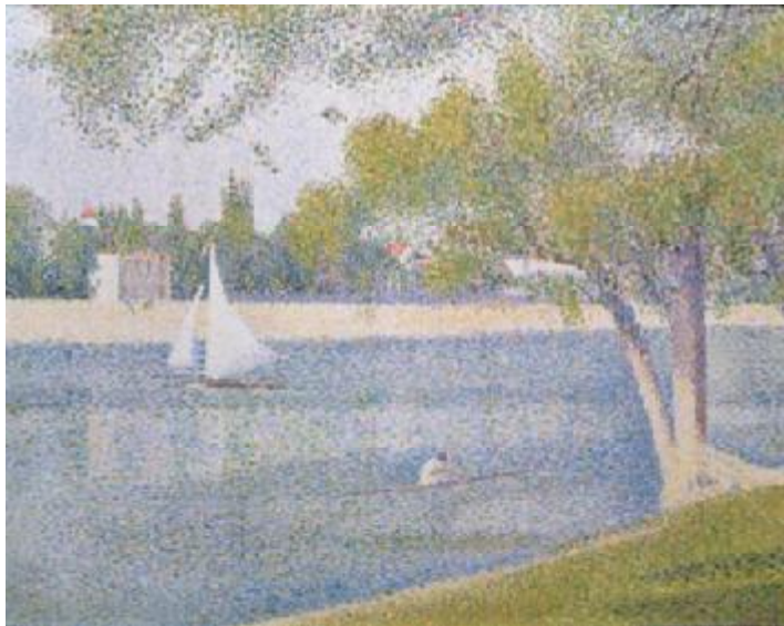
Georges Seurat, De Seine bij de Grande-Jatte , 1888 Olieverf op doek, 65 x 82 cm