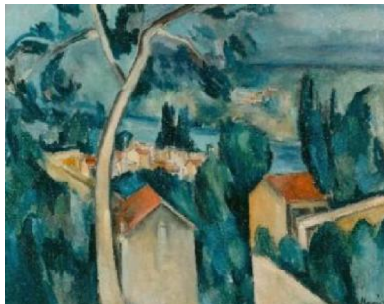
Maurice de Vlaminck, Landschap. De Seine bij Chatou, 1907-1908 Olieverf op doek, 68 x 73,6

www.extra-edu.be Tel. : +32 2 508 33 33 reservation@fine-arts-museum.be