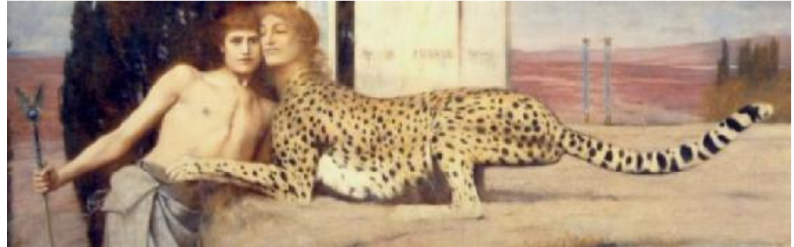
Fernand Khnopff, Liefkozingen , 1896 Olieverf op doek, 50,5 x 151 cm