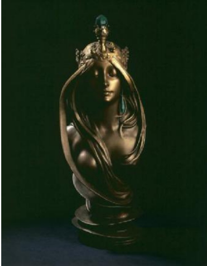
Alphonse Mucha, De natuur , 1899–1900. sculptuur van verguld brons met ornamenten van malachiet; uitgevoerd door Emile Pinedo. © Eingedom Brussels Hoofdstedelijk Gewest In depot KMKSB, Schenking Gillion Crowet, 2006 [Bruno Piazza (Gillion Crowet)].