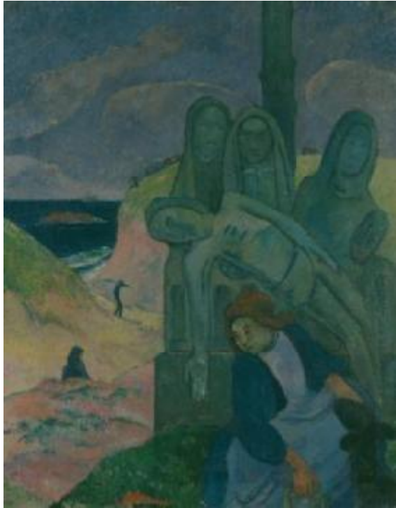
Paul Gauguin , Bretoense kruisweg , De groene Christus, 1889 Olieverf op doek, 92 x 73,5 cm