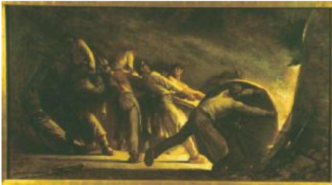
Constantin Meunier, De gebarsten smeltkroes , 1884