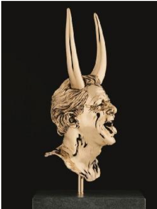
Jan Fabre, Hoofd © Angelos 2011.

Net zoals bij eerdere spraakmakende tentoonstellingen van Jan Fabre, zoals in het Louvre, zal het werk van Jan Fabre ook in de Koninklijke Musea voor Schone Kunsten van België geïntegreerd worden in het circuit van de zalen gewijd aan de Oude Meesters. In de ruimte aansluitend op de prestigieuze Rubenszaal zal de kunstenaar een klassieke beeldengalerij insceneren, met een seriële presentatie van eigentijdse zelfportretten, vervaardigd in traditioneel was en brons. Met de keuze voor een opvallende vloer in zwart-wit dambordmotief wenst de kunstenaar de traditie van de historische galerijen in zijn tentoonstellingsconcept op te nemen. Fantastiek en maatvolle orde vallen samen in een ruimte die kunsthistorische traditie en een actueel mensbeeld verenigt, hetgeen de lezing van de sculpturen een inhoudelijke ondersteuning biedt.