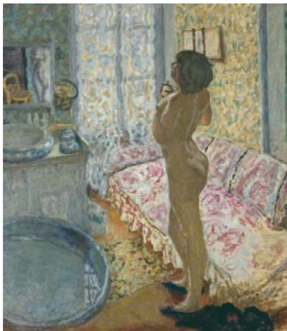
Pierre Bonnard, Naakt bij tegenlicht, 1908 MRBAB-KMSKB, Brussel

De bezoeker herleeft in dit museum het "Fin de siècle" doordat het in zijn historisch kader geplaatst wordt: het landschap en het modernisme, De Coster en het ontstaan van een nationale literatuur, de herontdekking van de primitieven, Rops en Baudelaire, de sociale kunst, de receptie van het impressionisme, het symbolisme in de literatuur en in de schilderkunst, Péladan en het idealisme, de sierkunsten van Brussel tot Nancy, de wagneriaanse Muntchouwburg, Brussel hoofdstad van de art nouveau, Spilliaert, Minne, Maeterlinck, de eerste Latemse school... Een uitgebreid programma waarvan we een volledig panorama zullen aanbieden in een combinatie van de tentoongestelde werken met hedendaagse technologische middelen. Dit avontuur is slechts mogelijk dankzij een partnerschap tussen de Koninklijke Musea voor Schone Kunsten van België, de Koninklijke Bibliotheek, de Koninklijke Muntchouwburg, alsook het Brussels Hoofdstedelijk Gewest, dat de schitterende collectie Gillion Crowet in depot gaf. De collectie Gillion Crowet is één van de hoogtepunten en tevens het eindpunt van het parcours. Het 'Musée Fin de siècle Museum' zal ongetwijfeld één van de parels van ons patrimonium worden.