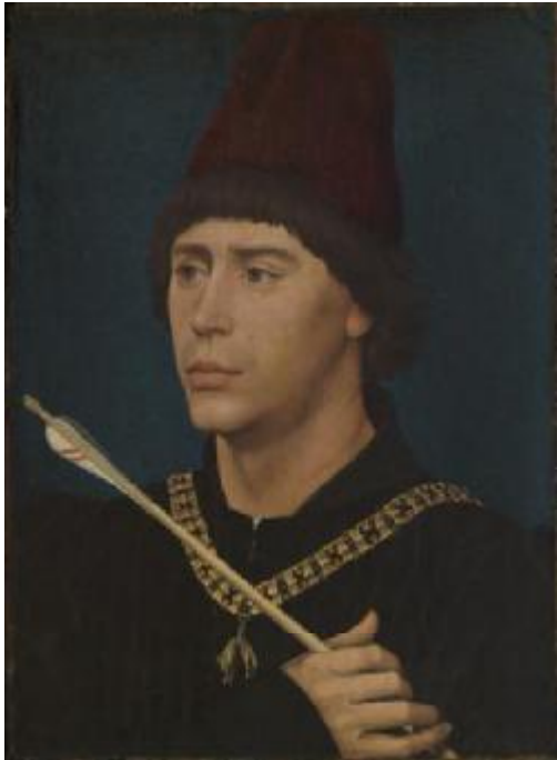
Rogier van der Weyden, Portret van Antoon van Bourgondië, 1456 - 1464

De Koninklijke Musea voor Schone Kunsten van België bereiden een tentoonstelling voor gewijd aan de schilderkunst te Brussel in de periode tussen de dood van Rogier van der Weyden en de opkomst van een nieuwe geest in de kunst van Bernard van Orley. De tentoonstelling zal een algemeen overzicht bieden van de schilderkunst te Brussel op het einde van de 15 de eeuw en het begin van de 16 de eeuw. Het is een periode waarin de stad in volle bloei verkeerde, met de hertogen van Bourgondië die het Paleis op de Coudenberg als hun favoriete residentie verkozen. De Koninklijke Musea voor Schone Kunsten van België bezitten een groot aantal schilderijen en een aantal cruciale werken uit deze periode. Dankzij de genereuze medewerking van verschillende musea uit Europa, de Verenigde Staten en privé-verzamelaars, zullen belangrijke werken die eertijds in Brussel gemaakt zijn, terugkeren naar hun 'geboorteplaats'. Zo is dit bijvoorbeeld het geval voor de Triptiek met de Mirakels van Christus . Een werk dat werd gerealiseerd in drie Brusselse ateliers en dat uit Melbourne wordt overgevlogen. Ter gelegenheid van de tentoonstelling wordt een wetenschappelijke publicatie uitgegeven met de meest recente onderzoeksresultaten. In deze publicatie zullen essays opgenomen worden van verschillende specialisten.