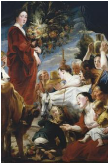
Jacob Jordaens, Hulde aan Ceres

Onder het beroemde trio van Vlaamse barokschilders 'Rubens-Van Dyck- Jordaens' is Jacob Jordaens (Antwerpen 1593-1678) het minst intens bestudeerd. De tentoonstelling zal van Jordaens een geheel nieuw beeld ophangen. In plaats van de schilder van de ongecompliceerde gezelligheid van 'De Koning drinkt!' en 'Zo de ouden zongen zo piepen de jongen', komt met het aanhalen van mythologische en antieke thema's hier een kunstenaar aan bod die op intelligente wijze marktaandeel afsnoept van Rubens. Meer dan 80 schilderijen en tekeningen, tapijten en beelden in bruikleen van beroemde musea en minder bekende privé-verzamelingen, van Spanje (Museo Nacional del Prado) tot Denemarken (Statens Museum for Kunst) en van het Verenigd Koninkrijk (Glasgow Museum and Art Gallery) tot Oostenrijk (Albertina), worden voor de tentoonstelling aangevuld met meesterwerken van Jordaens uit Brussels en Kassels bezit. Een tweede venue is van 1 maart tot 16 juni 2013 gepland te Kassel in het Fridericianum-Museumslandschaft Hessen.