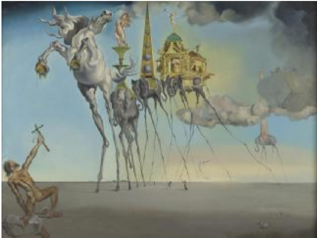
Salvador Dalí, De bekoring van Sint-Antonius , 1946 MRBAB-KMSKB, Brussel, fotograaf J. Geleyns © Sabam, Belgium, 2011.

In samenwerking met de Stichting Beyeler, vindt in de Koninklijke Musea voor Schone Kunsten van België een grote tentoonstelling over het surrealisme plaats. Meer dan een simpele artistieke moderne stijl, was het surrealisme waarschijnlijk de meest invloedrijke kunststroming van de 20ste eeuw. Deze stroming ontstond tijdens het Interbellum te Parijs, waarna de stroming zich over de hele wereld deed gelden, met een dusdanige invloed dat de effecten ervan tot op heden merkbaar zijn. Meerdere belangrijke persoonlijkheden uit de wereld van de moderne kunst hebben deel uitgemaakt van deze stroming, zijn er nauw bij betrokken geweest of hebben zich laten inspireren door deze stroming. Dit is met name het geval voor de volgende kunstenaars: Hans Arp, Hans Bellmer, Viktor Brauner, Salvador Dalí, Giorgio de Chirico, Paul Delvaux, Marcel Duchamp, Max Ernst, Alberto Giacometti, René Magritte, André Masson, Roberto Matta, Joan Miró, Meret Oppenheim, Wolfgang Paalen, Francis Picabia, Pablo Picasso, Man Ray et Yves Tanguy. Van deze kunstenaars zullen creaties worden getoond, met name schilderijen, maar ook beeldhouwwerken, tekeningen, objecten en foto's.