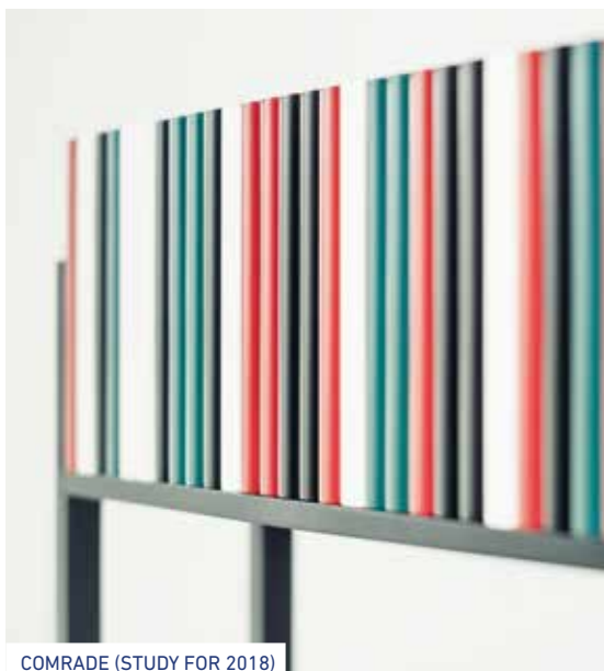
COMRADE (STUDY FOR 2018)