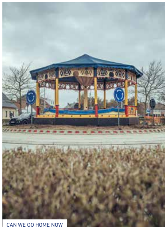
CAN WE GO HOME NOW

Rondpunt tussen Vloedstraat en Ebbestraat, Bredene