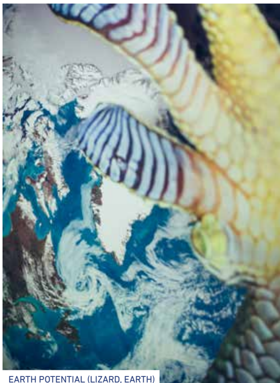
EARTH POTENTIAL (LIZARD, EARTH)

Van Simaey herinnert zich dat zijn ouders een extra rondje reden op het rondpunt om de kinderen te plezieren, wat hem deed geloven dat rotondes enkel daarom bestonden. Deze disfunctionele draaimolen is een vrijwel surrealistische installatie. De vrolijke taferelen, die zich op en rond deze draaimolen hebben afgespeeld, zijn slechts een vage herinnering geworden. Het kan ook een symbool zijn voor een moment van impasse. Er is slechts het voortdurende, autonome draaien, het volautomatisch functioneren volgens oude patronen, in de leegte van de reeds voltooide wereld en de statische rotonde.