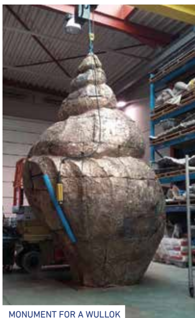
MONUMENT FOR A WULLOK

Inkomhal De Grote Post, Hendrik Serruyslaan 18a, Oostende • elke dag van 9u - 23u