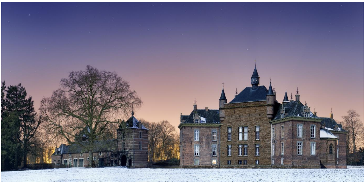
Kasteel de Merode in Westerlo