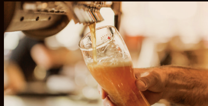
l'abus d'alcool est dangereux pour la santé, consommez avec modération

trouveront une partie restauration et boissons locales mais aussi un véritable espace de sensibilisation et d'animation autour de la nature et de l'aventure ! Par ailleurs, quelques surprises musicales sont à prévoir.