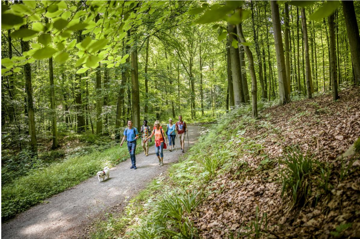
Wandelen in het Zoniënwood

Dat Vlaams-Brabant dé wandelprovincie bij uitstek is, vormt het uitgangspunt voor een wervende sociale mediacampagne .