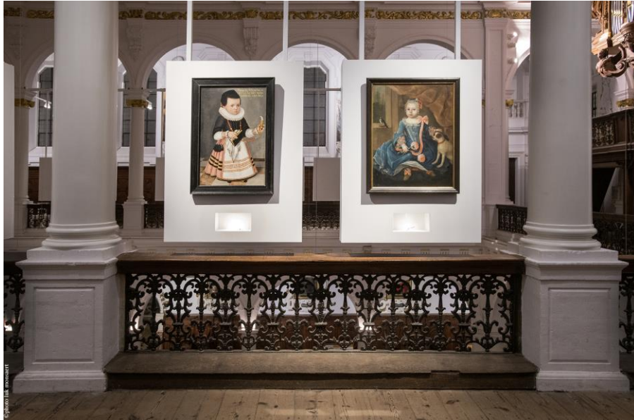
Kinderportretten in de Sint-Carolus Borromeuskerk

Naar aanleiding van de Nachten van de Geschiedenis van Davidsfonds geeft Katrijn ook op 9 maart een webinar over de tentoonstelling. Meer informatie vind je hier .