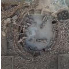
8 MB jpg Karahantepe 01.JPG