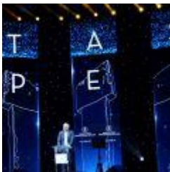
1.3 MB jpg _DSC3924.JPG