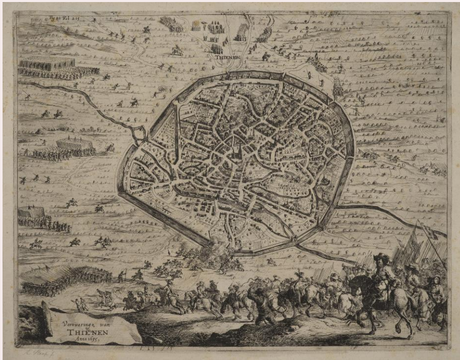
Anoniem, 'Veroveringh van Thienen', na 1635