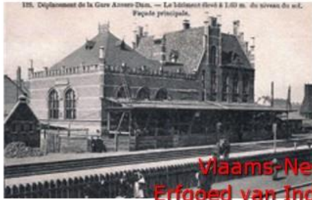
In 1907 wordt het station Antwerpen-Dam 1,60 meter hoog opgevijseld tijdens zijn verplaatsing.