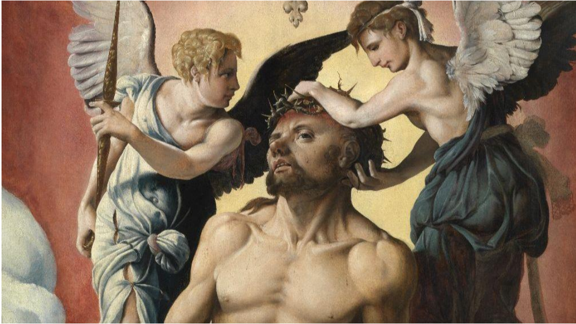
Maarten van Heemskerck, De man van Smarten , 1532, MSK Gent