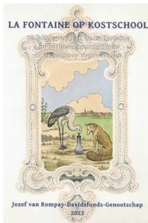
Het La Fontaineboek