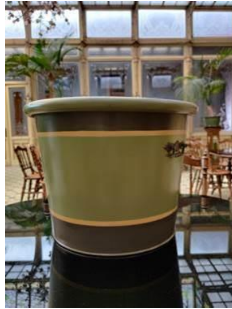
Eén van de twee bewaard gebleven sierpotten naast een gereproduceerd exemplaar