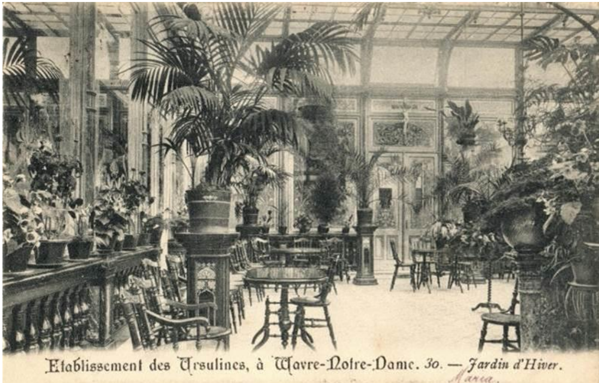
Een weelderige wintertuin anno 1904