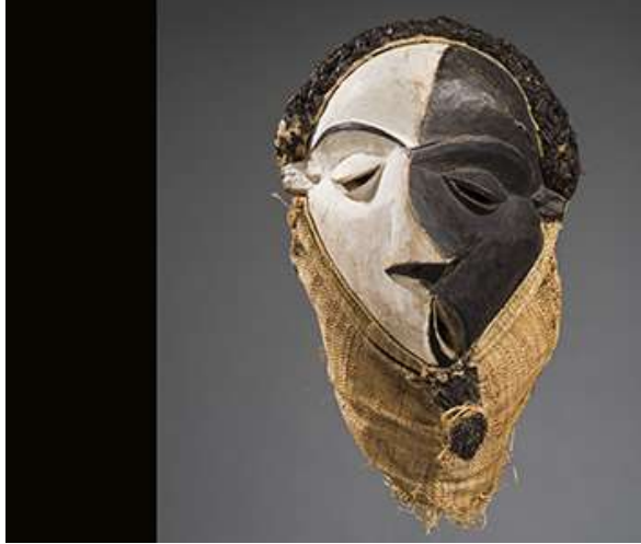
EO.1959.15.18, collectie KMMA Tervuren

In nauwe samenwerking met het Musée national Picasso-Paris wijden de KMSKB een unieke tentoonstelling aan Pablo Picasso. De twee instellingen ontcijferen een nooit eerder onderzocht thema: voor de allereerste keer wordt Picasso's relatie met de abstracte kunst belicht.