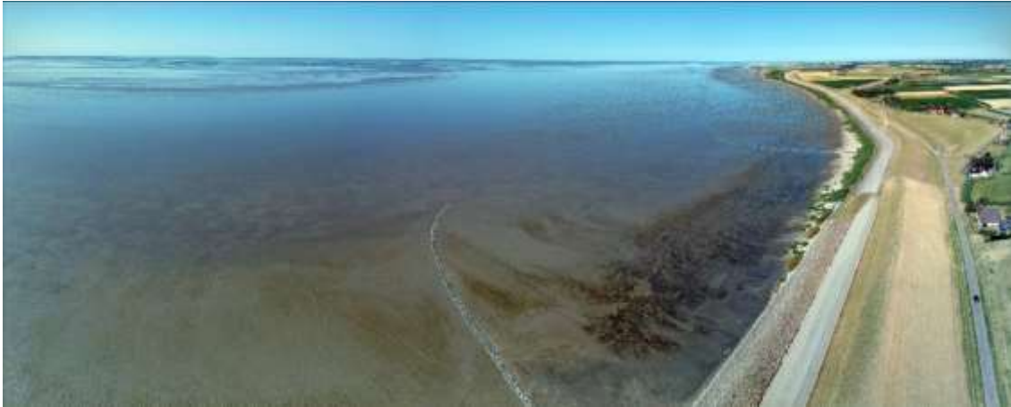
Video Landschapstriënnale 2023 - Dynamische Waddendelta