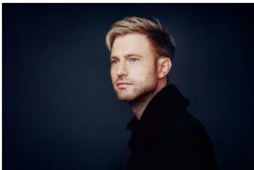
Benjamin Appl ©David Ruano