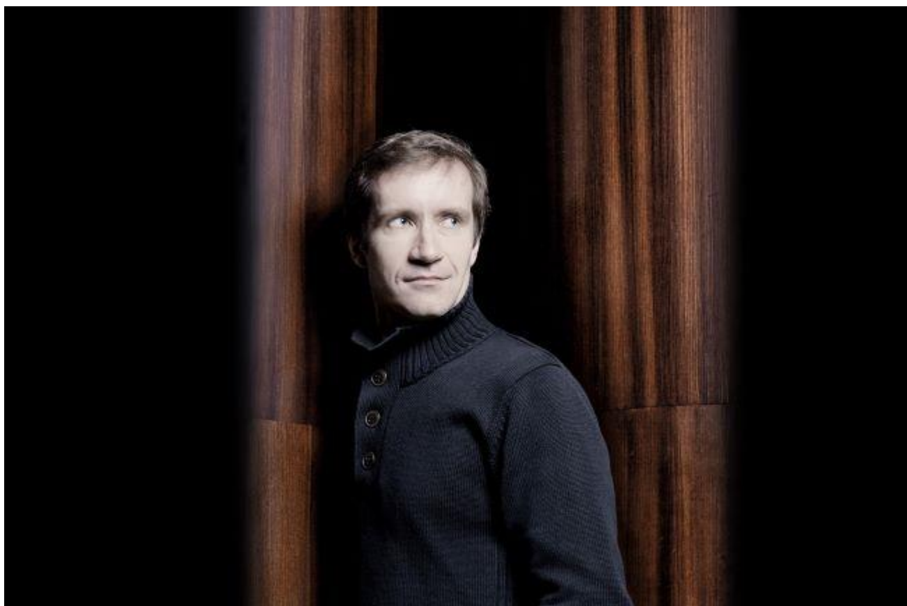
Nikolai Lugansky