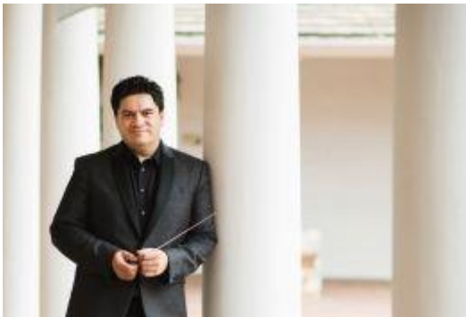
Cristian Măcelaru