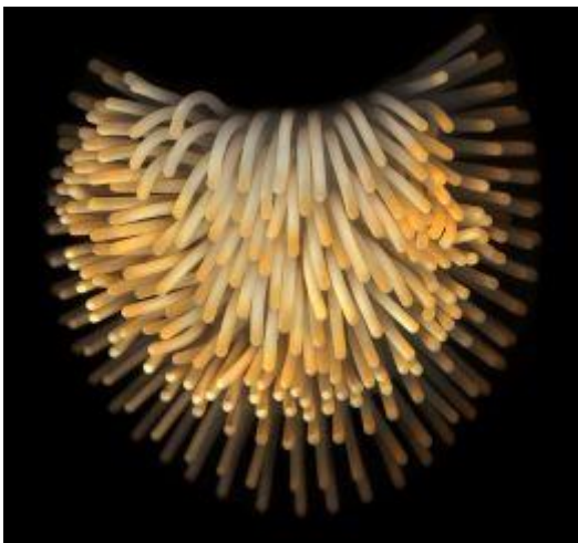
De Munt_De Munt ©Lauren Hennessy