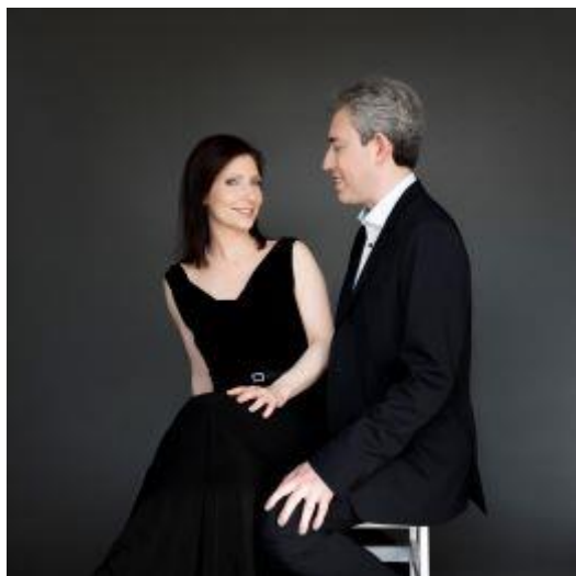
Zilver-Garburg ©Neda Navaee