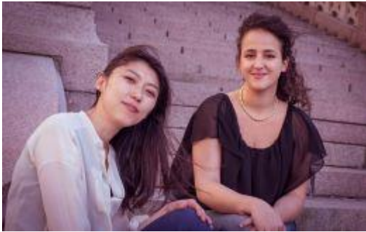
Duo 2 ©GR-DR