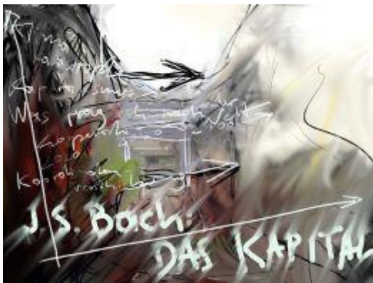
JS Bach, Das Kapital ©Leonhard Bartussek