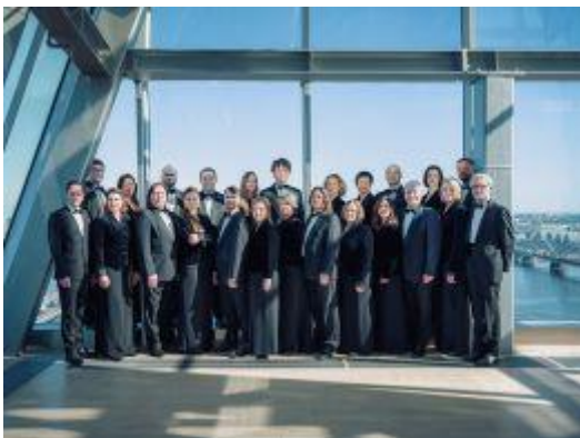
Lets radiokoor