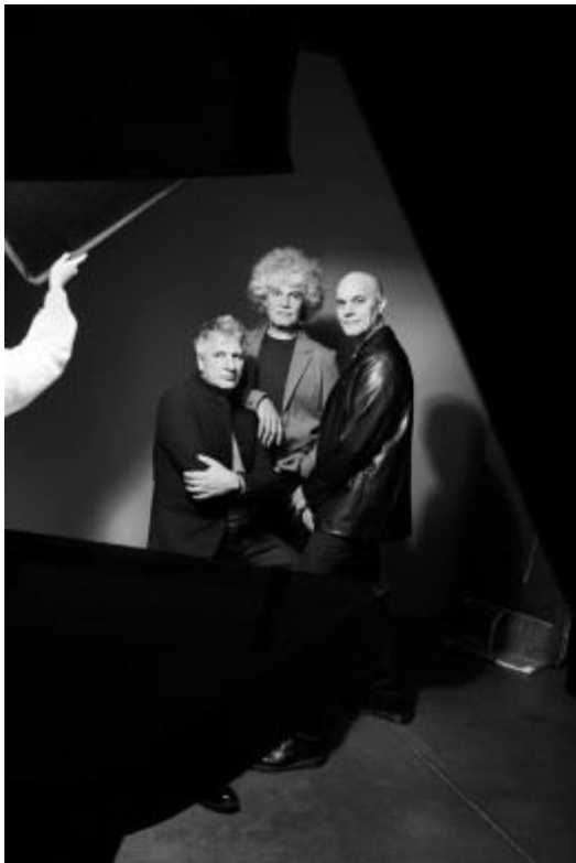
Ook bekend als Maan