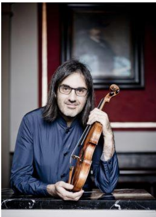
Leonidas Kavakos