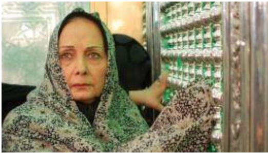
'Teheran, Teheran' (stil) © Dariush Mehrjui