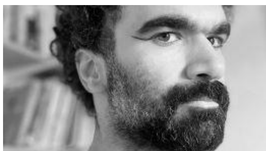
Pouya Ehsaei © DR-GR-RR