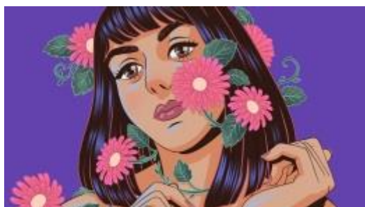
Marjan Farsad