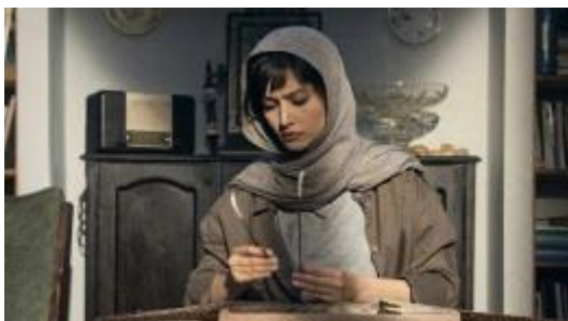
'A Minor' (still) © Dariush Mehrjui