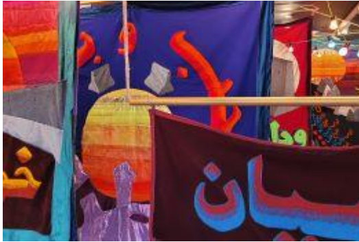
Doorlopende stad © Golrokh Nafisi