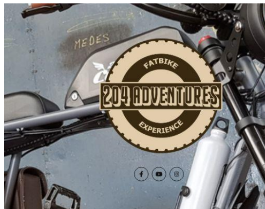
Gastronomische fietstocht 204 de hele zomer door!