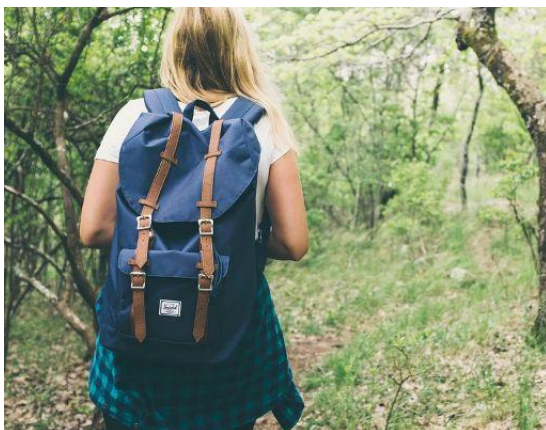
Natuurwandeling (Esneux) 05 en 08/03/2023