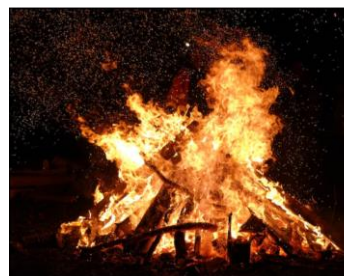
Grote brand van Plainevaux (Neupré) 03/11/2023