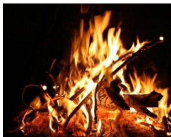
Grote brand van My (Ferrières) 04/03/2023