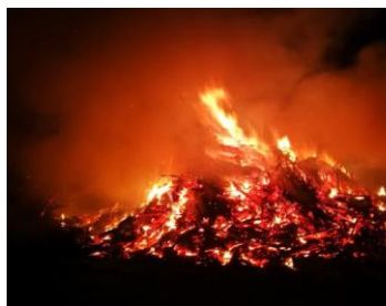
Groot vuur van Sprimont 04/03/2023

Grote vuren, een traditie die vooral in onze streek geworteld is! Ze symboliseren het einde van de winter en de terugkeer van warmere dagen.