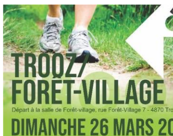
Marche Adeps (Trooz) 26/03/2023