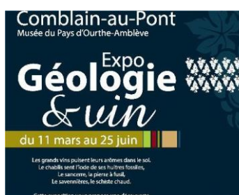
Exposition géologie & vin (Comblain-au-Pont) Jusqu'au 25/06/2023