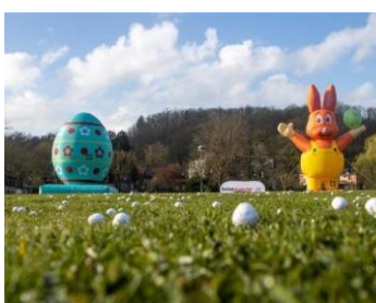
Chasses aux œufs (Esneux) 01/04/2023