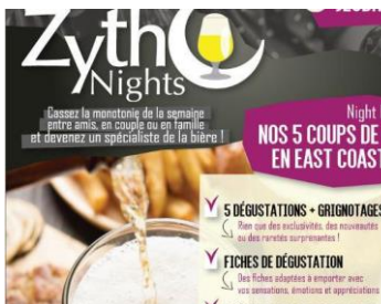
Zytho Nights: Nos 5 coups de coeur en East Coast IPA (Anthisnes) 06/04/2023