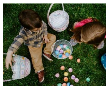
Grande chasse aux œufs (Trooz) 02/04/2023