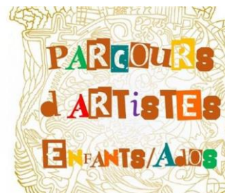
Exposition - Parcours d'artistes enfants/ados (Esneux) 12/03/2023