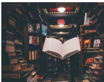
2ème salon du livre (Hamoir) Du 25 au 26/03/2023