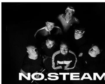
Nosteam (Jazz- Funk) (Sprimont) 25/03/2023