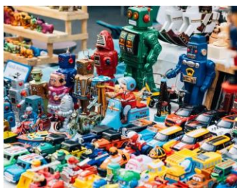
Bourse aux jouets (Comblain-au-Pont) 02/04/2023