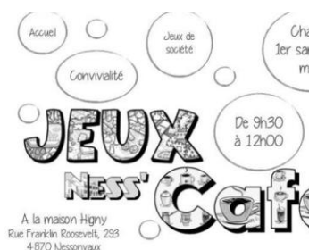
Jeux Ness Café (Nessonvaux) 01/04/2023