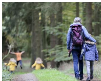
Marche Adeps (Deigné) 26/03/2023