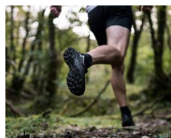
Trail Forestois 2ème édition (Trooz) 25/03/2023