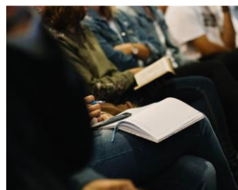
Une alimentation saine et locale. C'est possible ? (Trooz) 06/04/2023