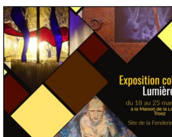
Exposition collective "Lumière!" (Trooz) Jusqu'au 25/03/2023