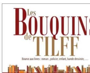
Les Bouquins de Tilff 25/03/2023