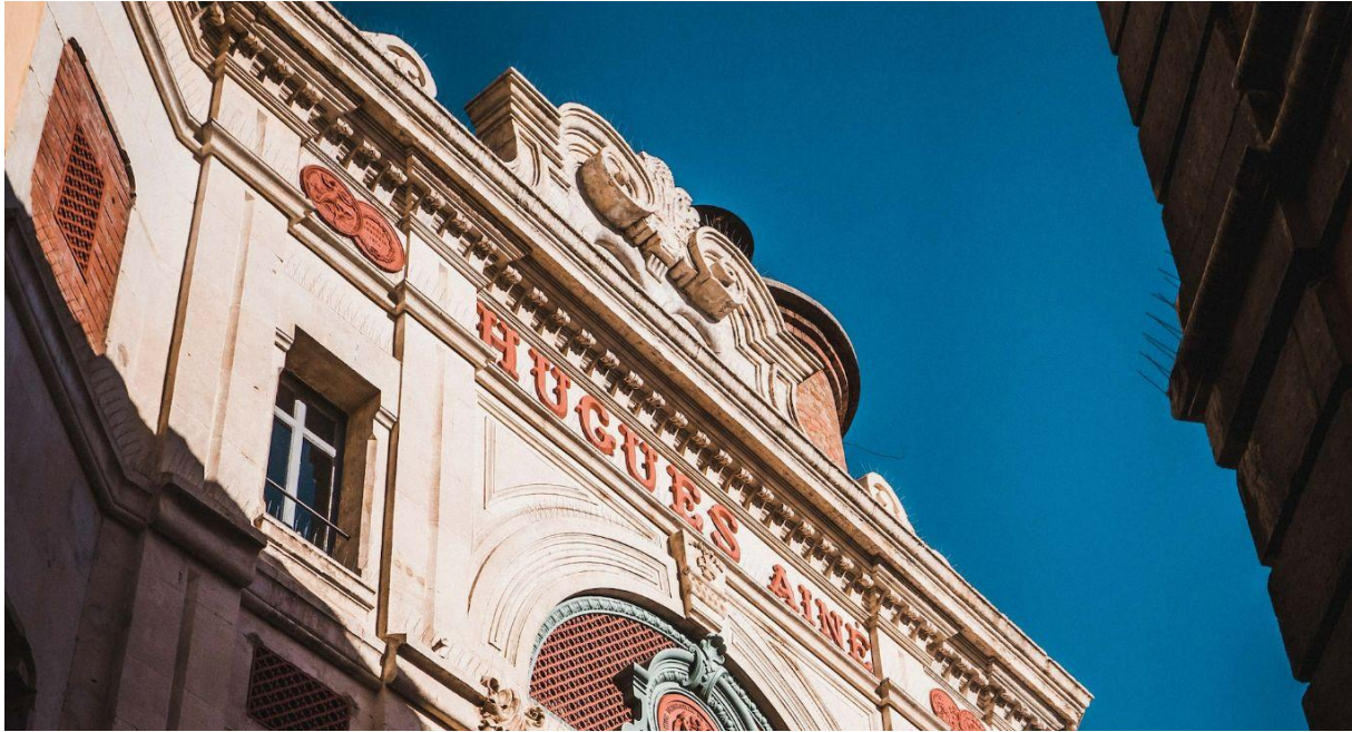
Gerti Gjuzi © unsplash

Le sud se place sans surprise en haut du classement, la ville la plus ensoleillée de France se trouve donc être Grasse . Accompagnée toute l'année par le soleil emblématique de la Côte d'Azur , il semblerait qu'il ne soit pas si facile de trouver un coin d'ombre à Grasse. En effet, la ville cumule une moyenne mensuelle de 285 heures de soleil environs ce qui la place sans difficulté en haut de notre liste.