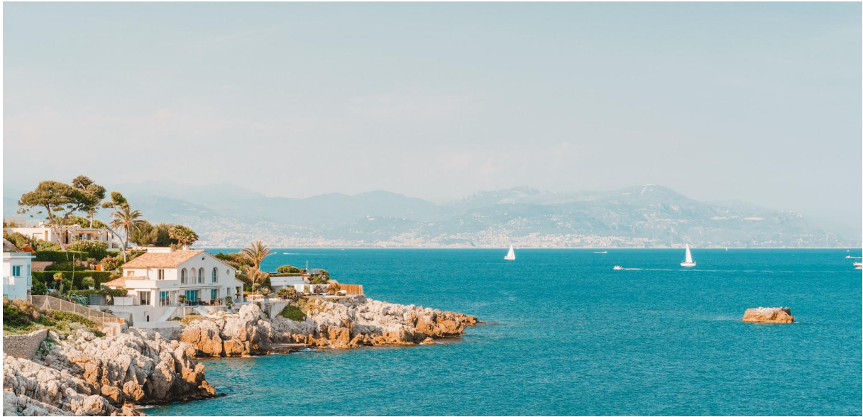
Anthony Salerno © Unsplash