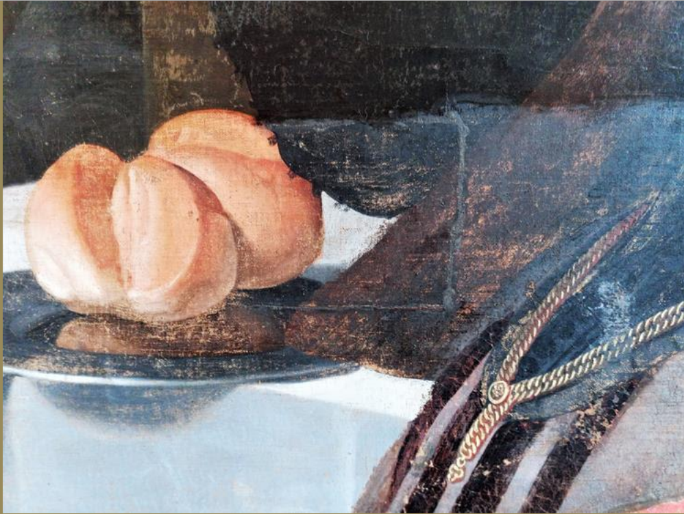
Tijdens de reiniging

"Ik merkte meteen dat het schilderij vol problemen zat. Pas na het verwijderen van de vernis en de overschilderingen kwam het echte beeld tevoorschijn, zoals vaak het geval is in ons vak. De geoxideerde vernis en de gewijzigde retouches uit het verleden - die op vele plaatsen zichtbaar waren - verhulden een overmatig versleten originele verflaag die in de afgelopen vijf eeuwen duidelijk zware beproevingen had doorstaan."