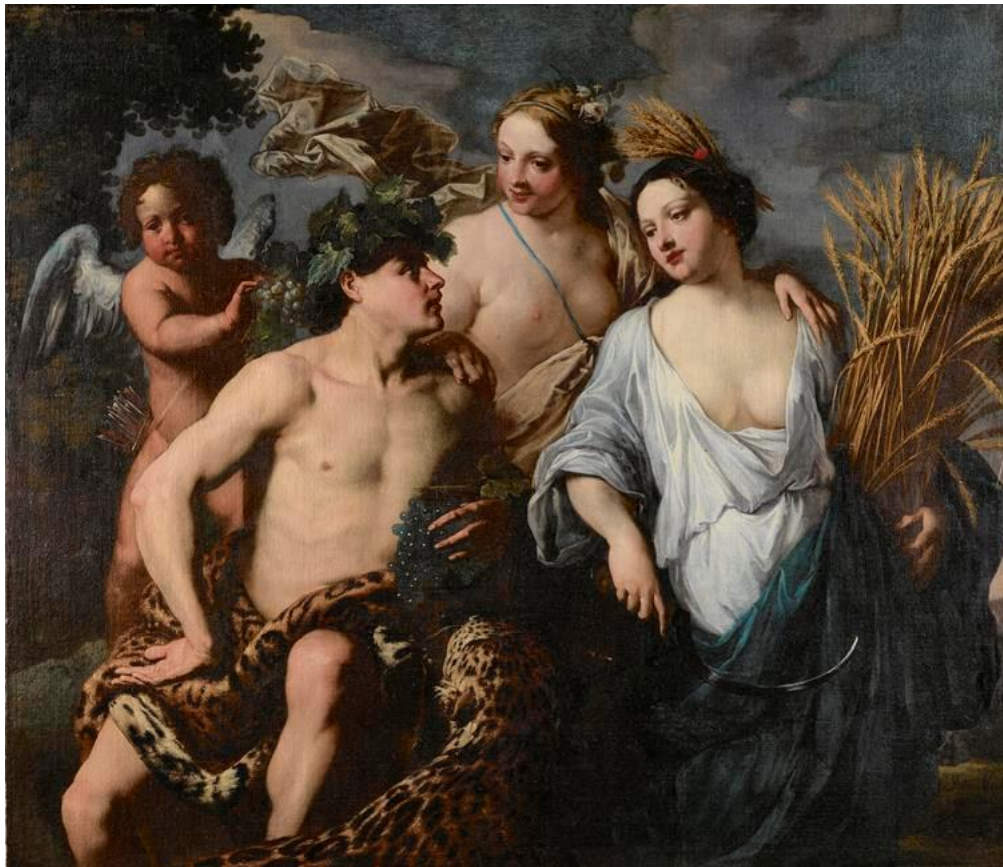
Jan Miel, Ceres, Bacchus en Venus , 1645

De Bentvueghels: een berucht kunstgenootschap in Rome , een gloednieuwe expo in het Centraal Museum in Utrecht, vertelt het verhaal van een groep kunstenaars uit de Noordelijke en Zuidelijke Nederlanden die samenkwamen in Rome aan het begin van de zeventiende eeuw. Het illustere gezelschap doopte zichzelf 'De Bentvueghels' en bestond uit kunstenaars als Abraham Bloemaert en Samuel Van Hoogstraten. In de tentoonstelling in Utrecht maak je kennis met de leden van deze eigenzinnige kunstenaarsgroep en ontdek je ook drie werken uit onze collectie van de hand van Jan Miel.