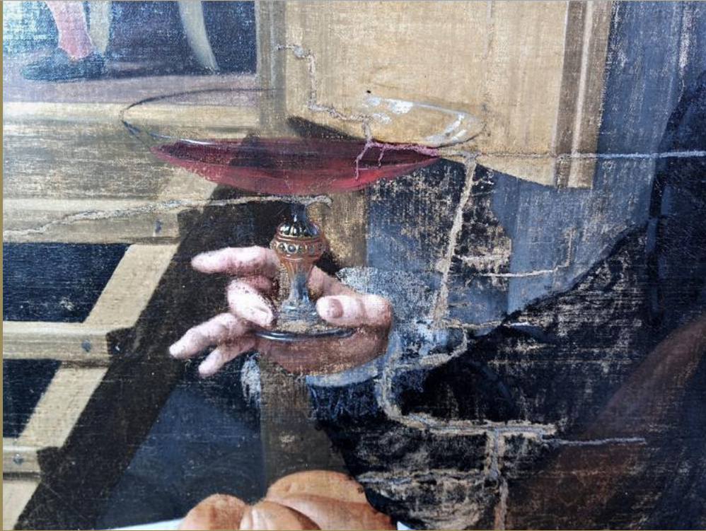
Voor het aanbrengen van retouches

"Het retoucheren van het schilderij na de reiniging was bijgevolg erg moeilijk waardoor ik progressieve en kritische keuzes moest maken om dit te kunnen uitvoeren. Aangezien het werk algemene slijtage vertoonde was het noodzakelijk om oplossingen te vinden die de schade op een "illusionistische manier" konden verbergen maar tegelijkertijd ook de materiële geschiedenis van het werk respecteerden. Met andere woorden moest ik het beschadigde beeld subtiel herintegreren door tegelijkertijd de slijtage te imiteren. Het was een echte uitdaging om deze techniek coherent toe te passen in de hele compositie. Bovendien was ook een stevige portie gezond verstand van belang om op tijd te stoppen met de retouches. Je zou immers gemakkelijk kunnen overdrijven en eindeloos blijven retoucheren."