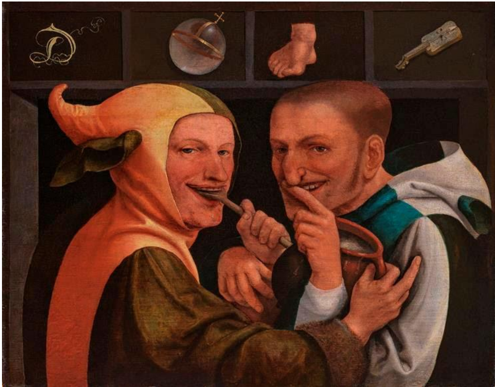
Jan Massijs, Rebus: de wereld voedt veel zotten , ca. 1530

Van 19 februari tot en met 25 juni kan je de werken van Hans Memling, Jan Gossaert, Jan en Catharina Van Hemessen, Peter Paul Rubens, Jacob Jordaens en andere grootmeesters bewonderen in het Dallas Museum of Art!