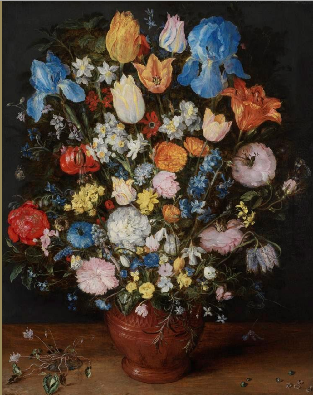
Jan I Brueghel, Bloemenvaas met varkensbrood en edelstenen , 1605-1607