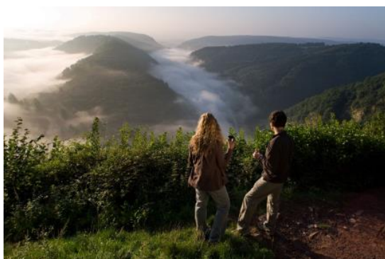
Actief in het voorjaar

Met dit in het achterhoofd wensen wij u een fijne start van de lente! Uw team van het VVV-kantoor van Saarland