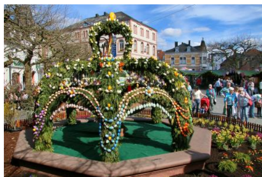
Paasmarkt in St. Wendel