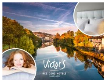
Einchecken & Entdecken!