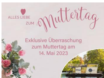
Muttertag mit „Ebbes von Hei“