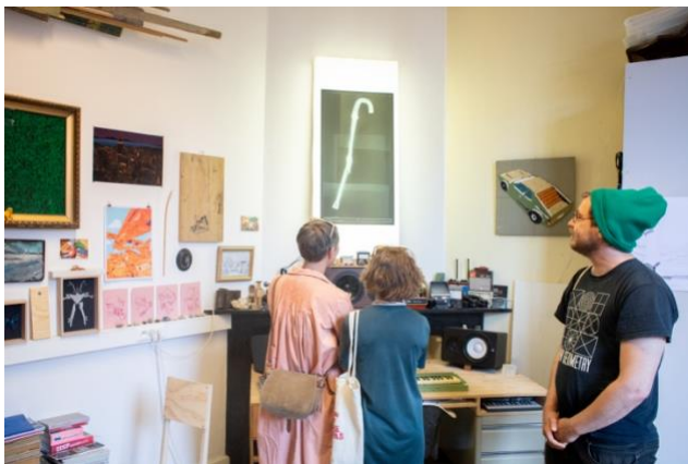
Nucleo Convent, Gent