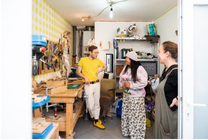
Level 5, Ganshoren © Lucas Denuwelaere