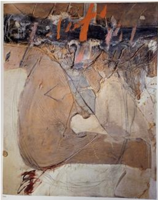
Antoni Tàpies, Cos de materia I taques taronges (Lichaam van materieel en oranje vlekken) 1968, Gemengde techniek op doek, Privécollectie, Barcelona © Comissió Tàpies