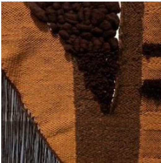
Kapwani Kiwanga, Zaadbank, 2020, wolweefsel en geglazuurd keramiek. Met dank aan de artiest. Tentoonstellingsoverzicht Kapwani Kiwanga, nieuw werk, 2020, bij het voormalige Witte de With Center for Contemporary Art. Fotograaf Kristien Daem