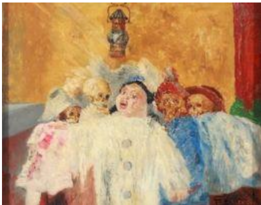
James Ensor, Pierrot en skeletten , 1905, KBC Kunstcollectie