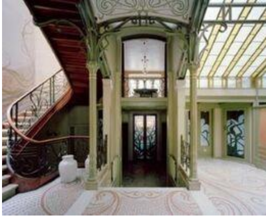
Victor Horta, Tasselhuis