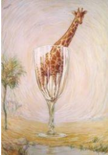
René Magritte, Le bain de cristal , 1946, Collection privée