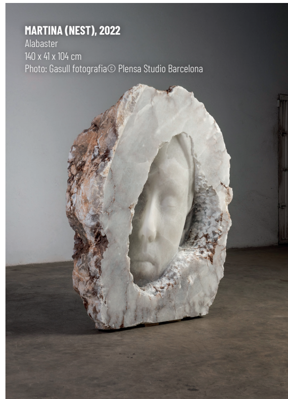
MARTINA (NEST), 2022

De majestueuze volumes van de kapittelkerk, die werd gebouwd door kanunnikessen in de 15 e eeuw, maken indruk op bezoekers zodra ze het gebouw betreden. Deze Dames hadden beslist ambities voor hun stad. De kanunnikessen, die van adellijke afkomst waren, hadden een visionaire geest en zaten in de artistieke voorhoede van hun tijd, zowel op architecturaal als op sculpturaal vlak. Ze deden dan ook een beroep op Jacques Du Broeucq, een van de grootste beeldhouwers van de zuidelijke Renaissance, om het doksaal te maken: een monumentale stenen wand die het schip scheidt van het priesterkoor. Het doksaal werd ontmanteld tijdens de Franse Revolutie, maar gelukkig werden daarbij een reeks albasten beelden en hoogreliefs gered. De meester-kunstenaar van keizer Karel V tekende hier voor een werk in de meest loepzuivere renaissancestijl van zijn tijd. Kijk maar naar de transparante witheid van de weergave van de stoffen, de levendige gelaatsuitdrukkingen of de harmonie van de lichaamsverhoudingen. Zijn stijl breekt met de middeleeuwse esthetiek die tot dan heerste in onze zuidelijke landstreken. Tegenover dit beeldhouwwerk in de geest van het humanisme, plaatst Jaume Plensa kwetsbare gezichten, genesteld in een cocon van doorschijnend albast. Vijf eeuwen scheiden deze werken van elkaar en toch straalt het materiaal dezelfde tijdloze zachtheid uit, waardoor ze de tand des tijds zonder enige rimpel doorstaan.