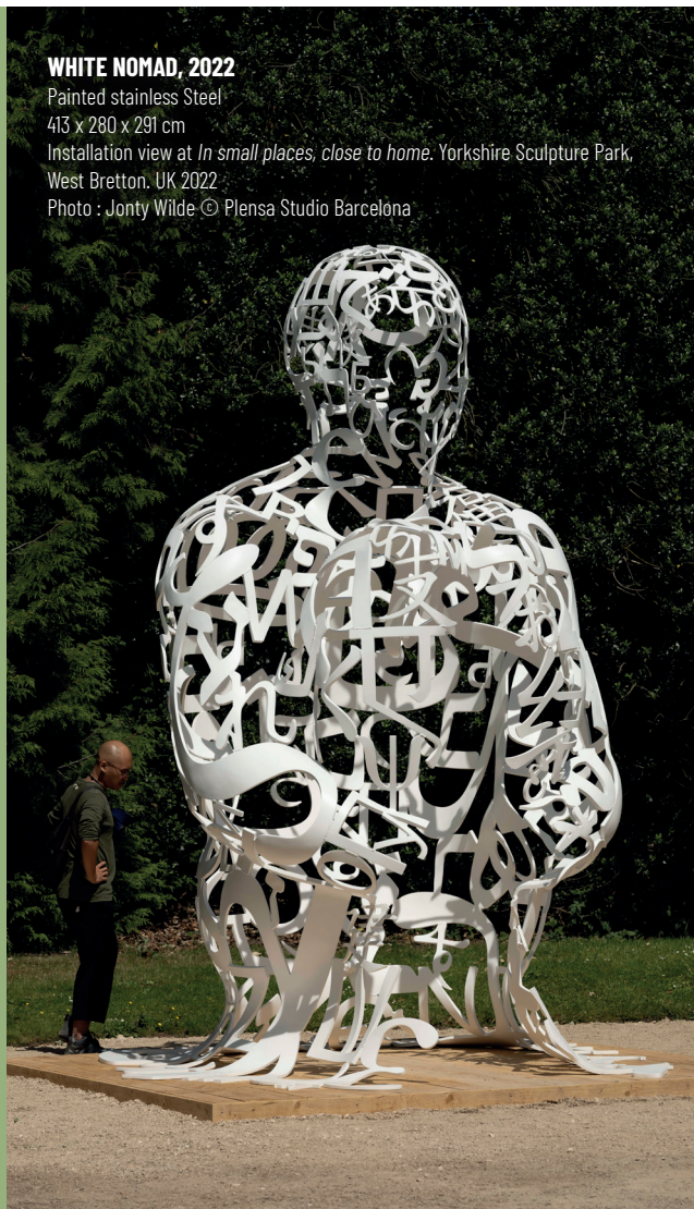
WHITE NOMAD, 2022

Met White Nomad maakt Jaume Plensa ons deelgenoot van deze ervaring. Door deze cocon binnen te treden, kunnen we de wereld om ons heen bekijken door het prisma van de woorden en letters waaruit de lichamen bestaan.