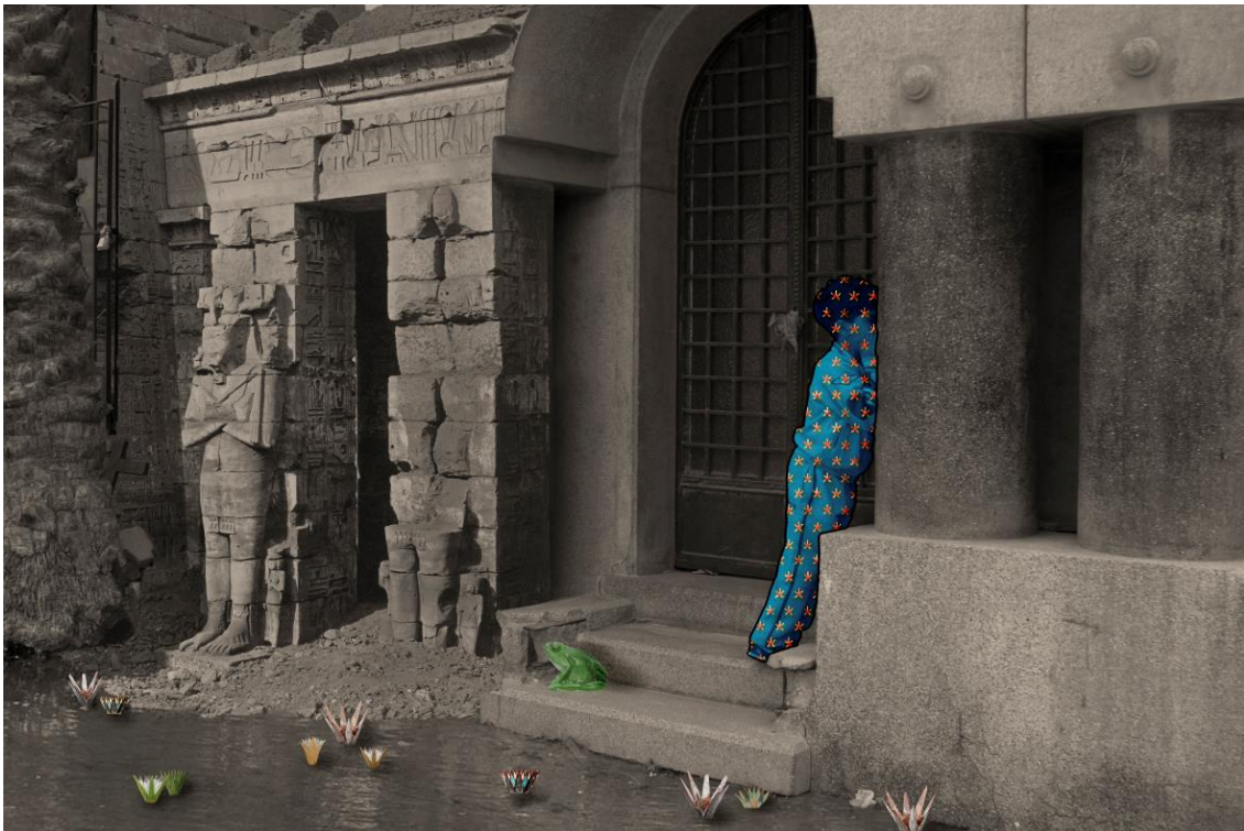
Sara Sallam, Lotus and Heqet from the series Playing in Fields of Reeds, 2014/2021 © Sara Sallam