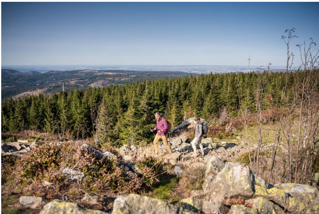
Wandelaars in de Harz: © Markus Tiemann

Torfhaus ligt op een hoogte van 812 meter en is ooit gesticht door turfstekers die in het nabijgelegen hoogveen werkten. Tegenwoordig is het plaatsje het hoogstgelegen vakantieoord van Nedersaksen. Vanwege de gunstige ligging, het heerlijke uitzicht op de Brocken, met zijn 1141 meter de hoogste berg van Noord-Duitsland, en het uitgebreide netwerk van wandelpaden en loipes is het de ideale uitvalsbasis voor tochten door de wildernis van Nationalpark Harz. Dit unieke middelgebergte fascineert met hoogveen en heide, klaterende beekjes, grillige rotsformaties en uitgestrekte bossen. Maar liefst 97% van het nationale park is bos!