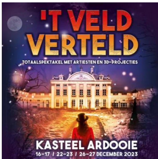
't Veld Verteld - Ardoonie

Familievriendelijke zoektocht in de Torhoutse binnenstad. ( 15/12-5/1/24 ).