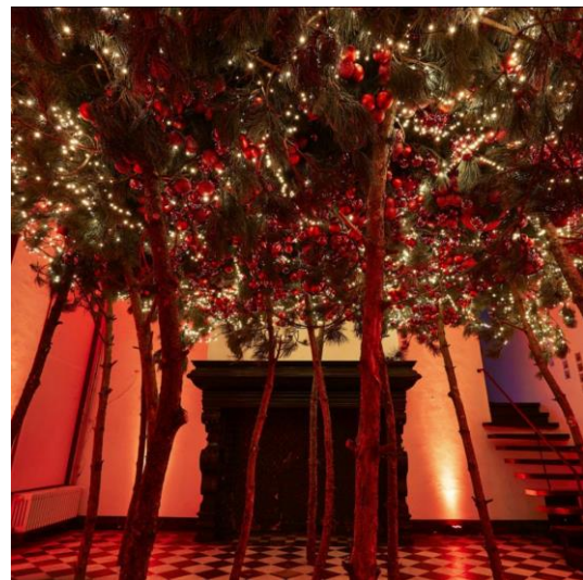
Wintersfeer in Damme

Een uniek lichtspektakel bij het Kasteel van Ardoonie. ( 16/12-27/12 )