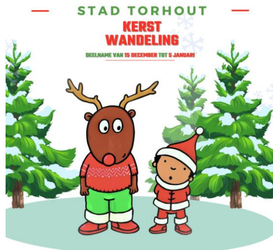
Kerstzoektocht 'op stap met Rendier Rudy' - Torhout

Ontdek het prachtige kerstverhaal in het kasteel van de Kerstman. ( 8/12-10/12 ).