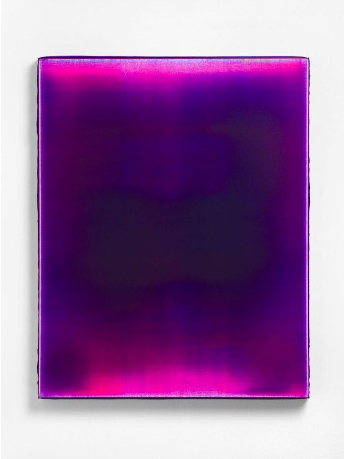
Telescopes no.1 , 2023, acrylverf op linnen, 100 x 80 cm