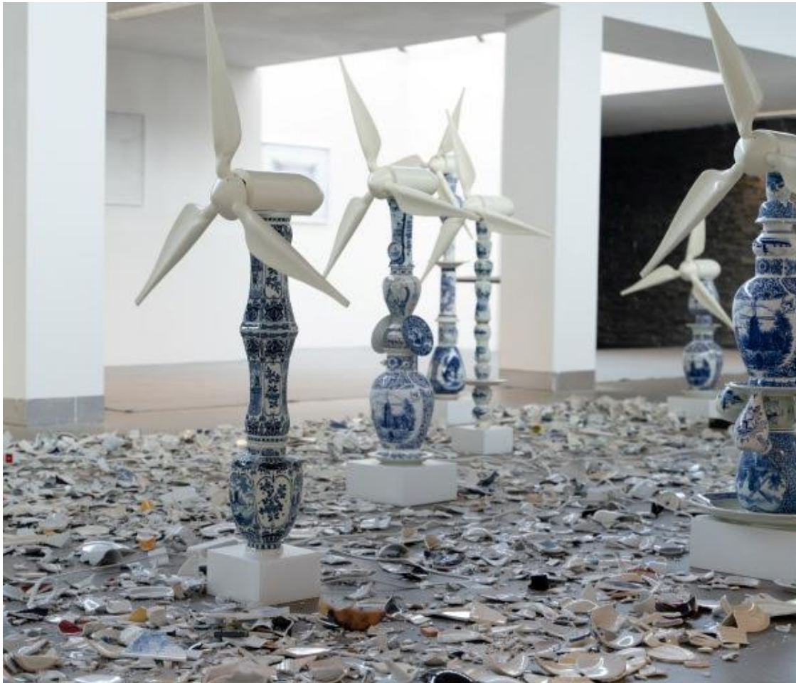
Noud Sleumer, Culturalized Wind Power.