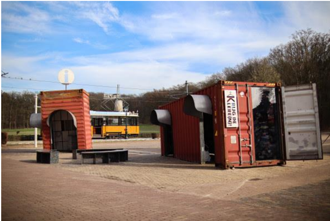
Mini-expo Krijg de Klere(n)! op het Entreeplein