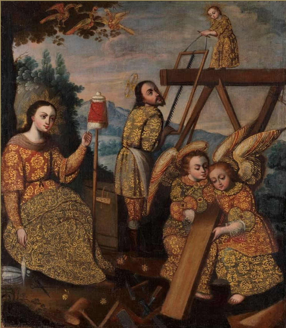
Diego Quispe Tito, Heilige Familie in Nazareth , ca. 1675