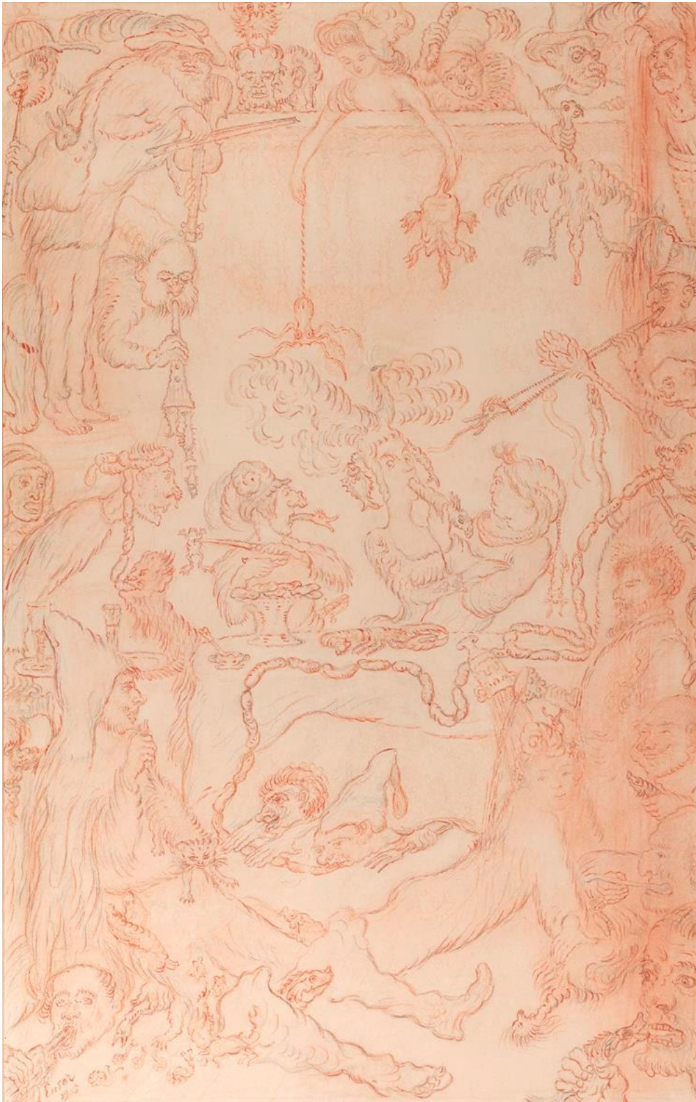
James Ensor, De komische maaltijd , 1905

Bozar brengt een eerbetoon aan de veelzijdigheid van James Ensor met de tentoonstelling James Ensor. Maestro , waar bezoekers de mogelijkheid hebben om maar liefst drie werken uit onze collectie te bewonderen.