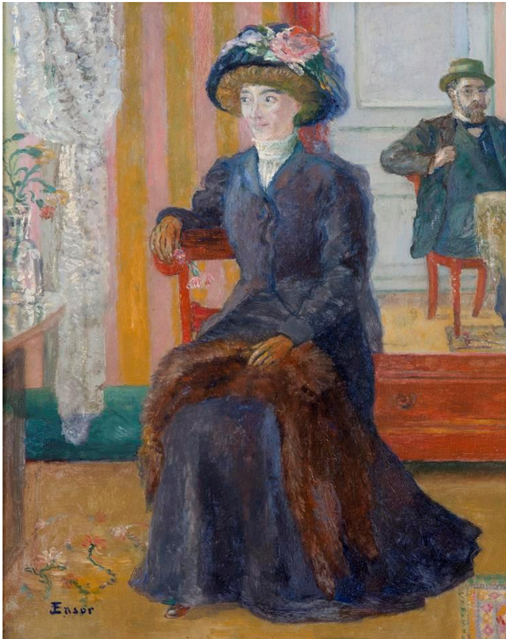
James Ensor, Onze twee portretten , ca. 1905