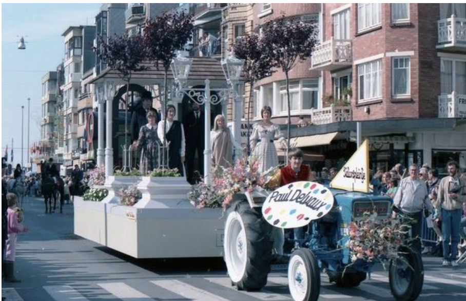
Bloemenstoet Koksijde 1 augustus 1984 De 34 e bloemenstoet in de Zeelaan was een hulde aan Paul Delvaux. Naast gewone thema's over Vlaamse schilderkunst, paardenvissers,... werd toen ook een hommage aan kunstschilder Paul Delvaux gebracht.

Zo werd in het jaar 1984 de praalwagen 'het stationspleintje' geïntroduceerd tijdens de 34 e editie van de bloemenstoet met als thema 'Verheerlijking van de Vlaamse Schilderkunst'.