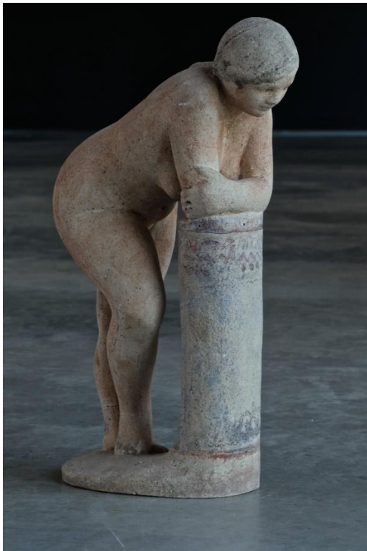
Foto beeld Grard – Staande vrouw leunend op een zuil – 1940-41 – cement – 29,5 x 10 x20 – privécollectie

Na al die eeuwen is er opnieuw een craftbrouwerij op Koksijdse abdijgrond, in de oude varkensstallen van de abdijhoeve Ten Bogaerde. Ontdek die op deze historische locatie. Met het St.-Idesbald-abdijbier, een extra knipoog naar Grard en Delvaux uit 'de School van Sint-Idesbald', komt het erfgoed letterlijk tot aan je lippen. Info: brouwerijsintidesbald.be