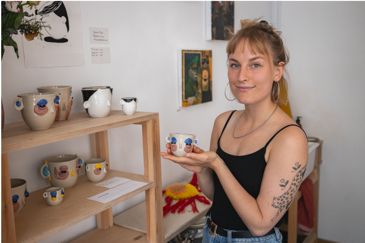
Kunstenares van het atelier "Terra Cotta"

De kunstenaarsateliers vormen de hoeksteen van het gebeuren.