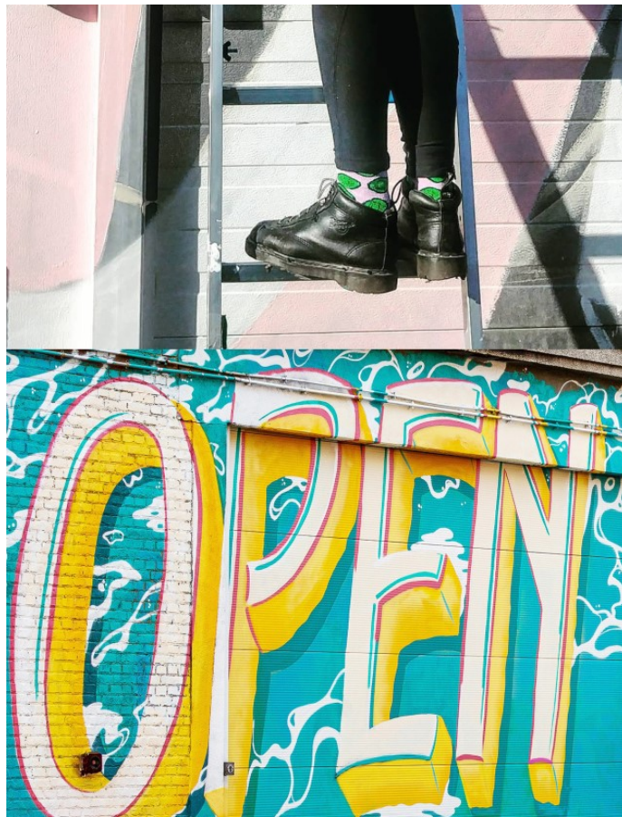
Kijk op een fresco van Charlotte Berg

In Maison Poème zal kunstenaar Charlotte Bergue een fresco tot stand brengen.