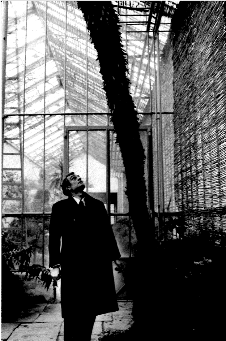
Marcel Broodthaers

Deze biënnale zal ook de honderdste verjaardag herdenken van Marcel Broodthaers, een belangrijke kunstenaar in de geschiedenis van de Belgische kunst, die in Sint-Gillis werd geboren. Voor deze gelegenheid zal het stadhuis het decor zijn voor een monografische tentoonstelling in de Europazaal, met verschillende werken van deze internationaal bekende kunstenaar, uitgeleend door verschillende Belgische musea (Museum van Elsene, het Centre de la gravure et de l'image imprimée en de KMSKB, onder voorbehoud van aanvaarding), die het Parcours officieel zal openen op vrijdagavond 12 april.