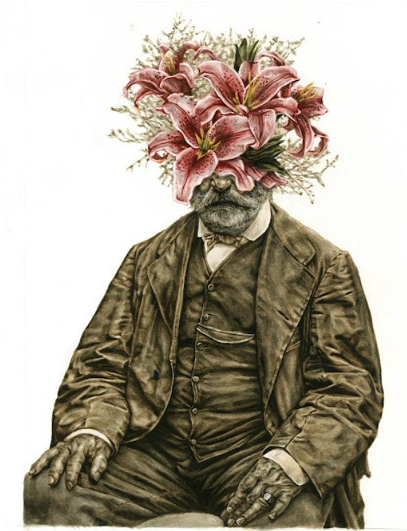
Aquarel & acryl van Milan Jespers