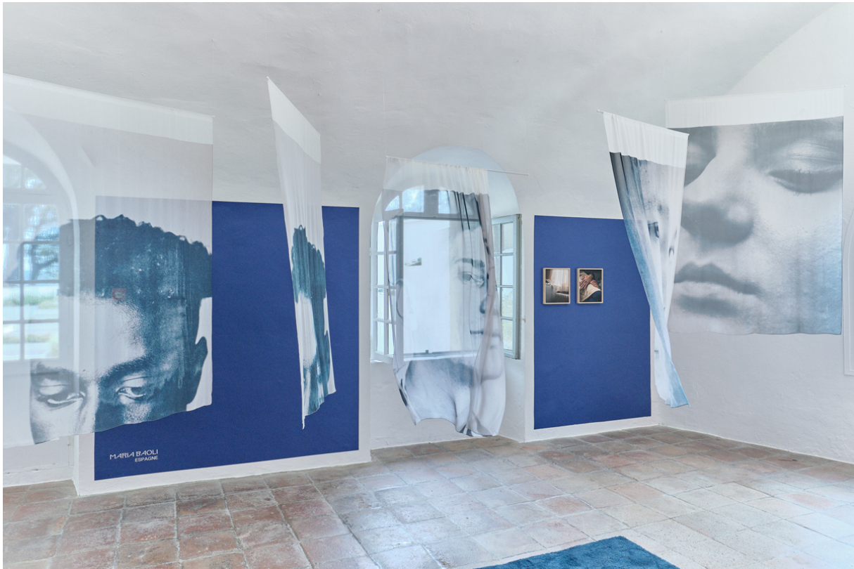
« The Mirror », tentoonstelling van Maria Baoli

In een nieuw onderdeel van het project 'The Mirror' (2020-2021), getiteld 'Toi(ts) la nuit', zal fotografe Maria Baoli haar ontmoetingen voortzetten met jongeren die in transitwoningen wonen die door CEMO ter beschikking worden gesteld in het kader van het KAP-project (Kot autonome Provisoire). Deze jongeren van 16 tot 25 jaar, die in de marge van de maatschappij leven en op de dool zijn, krijgen de kans om via fotografie te vertellen over de nieuwe horizonten die ze verkennen in hun pogingen om zelfstandig te worden in een eigen woning.