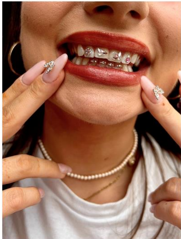
Beauty bar - Brillez Brussels