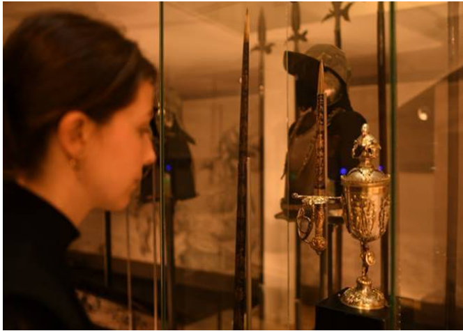
Johannes Wundes the Younger (blades) (active circa 1590-circa 1630), Clemens Einhorn (dagger) Ornamental weapons set of Elector John George I of Saxony Rapier and dagger, German, before 1640, blades from Solingen Iron, blued, gilt Rüstammer, Staatliche Kunstsammlungen Dresden, Germany

Een selectie zaalbeelden van de tentoonstelling en hoge resolutie beelden van een selectie van tentoongestelde objecten kunnen gedownload worden via deze link .