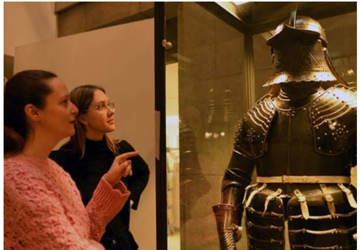
Christian Müller 'Pappenheimer' suit of armour of Elector John George I Dresden, circa 1620 Iron, forged, embossed, perforated, blackened; red velvet trim, leather Weight: 34.846 kg Rüstammer, Staatliche Kunstsammlungen Dresden, Germany Credit line: Staatliche Kunstsammlungen Dresden, Rüstammer photo: Jürgen Karpinski