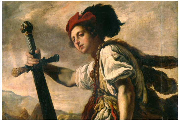
Domenico Fetti (1589-1623), David met het hoofd van Goliath, 1614/1615, Gemäldegalerie Alte Meister, Staatliche Kunstsammlungen Dresden, Duitsland

Tijdens de oorlog werden vooral cultuuroggoederen bedreigd. Koninklijke heersers waren zich bewust van het belang van kunstschaten. Er vonden onder andere plunderingen plaats bij de veroveringen van Heidelberg (1622), Mantua (1630), Mainz (1631), München (1632), Stuttgart (1634/35) en ten slotte Praag (1648). De overwinnaars namen kunstwerken en boeken in bezit, voegden ze toe aan hun eigen collecties of schonken ze in ruil voor gunsten. Gezien de achtergrond en bewogen geschiedenis kan geroofde kunst uit die periode