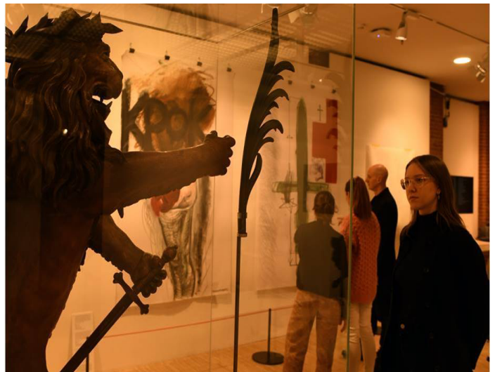
Swedish Wine Lion of the peace congress in Nuremberg, Schwedischer Weinlöwe Stadtmuseum Fembohaus, Museen der Stadt Nuremberg, Germany 1649 Wood, painted