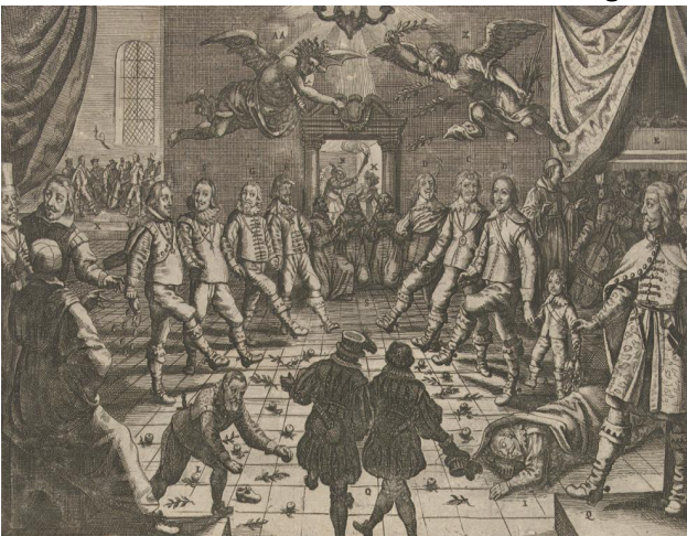
Simon van de Passe (?), "Het grote Europese oorlogsballet" Noordelijke Nederlanden, 1632, Rijksmuseum, Amsterdam, Nederland