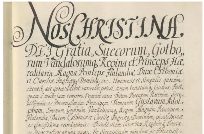
Ratificering van het Vredesverdrag van Osnabrück door koningin Christina van Zweden, Stockholm, 18 november 1648, Sächsisches Staatsarchiv – Hauptstaatsarchiv Dresden, Duitsland.