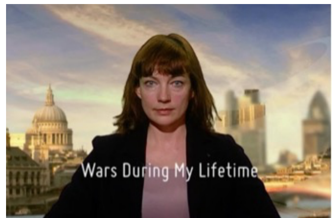
Martin John Callanan (geb. 1982), Oorlogen tijdens mijn leven (1982–2012), Met vriendelijke toestemming van de kunstenaar

Ondanks de Vrede van Westfalen in 1648 kwam er geen duurzame vrede in Europa. Oorlogen, militarisering en koloniale expansie gingen door, wat tot verwoestende conflicten leidde. Inspanningen voor universele vrede door initiatieven zoals de Haagse Conventies en de Volkenbond werden ondermijnd door de twee Wereldoorlogen. Hoewel de Europese Unie sinds de Tweede Wereldoorlog heeft voorkomen dat lidstaten oorlog tegen elkaar voeren, blijft de dreiging van conflicten in Europa bestaan, terwijl ze voortdurend wordt veroordeeld als middel om politieke doelen te bereiken.