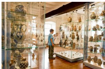
Kunst & cultuur