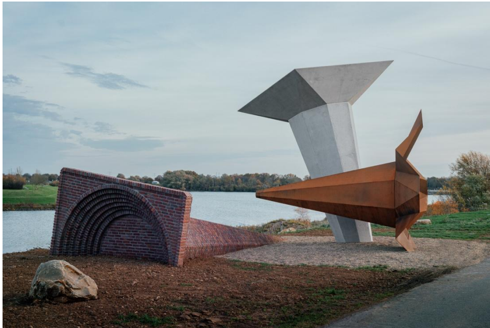
Kunst aan de Maas (Maaseik) | Adrien Tirtiaux, Echoes of a Landscape, 2025.