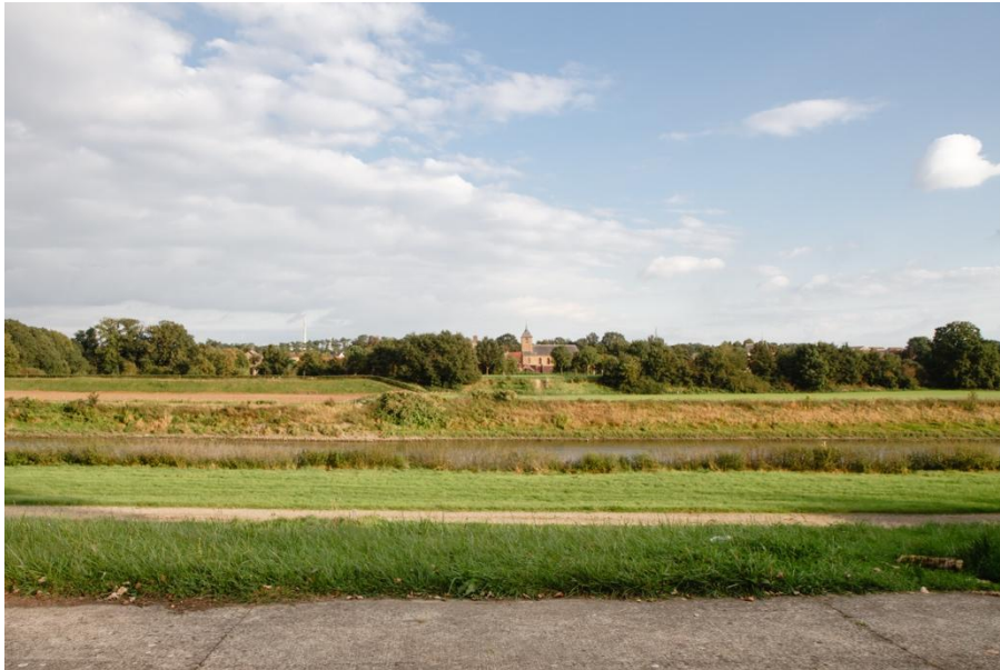
Maasoever in Maasmechelen, met blik op Nederland, waar het kunstwerk een plaats krijgt