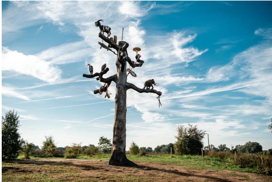
Kunst aan de Maas. Mark Dion, Tree of Life, 2022.

Sinds 9 oktober 2022 in Herbricht, Lanaken