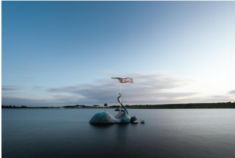
Kunst aan de Maas (Kinrooi) - Laure Prouvost. Moeder! Oui dream till the end, 2025.